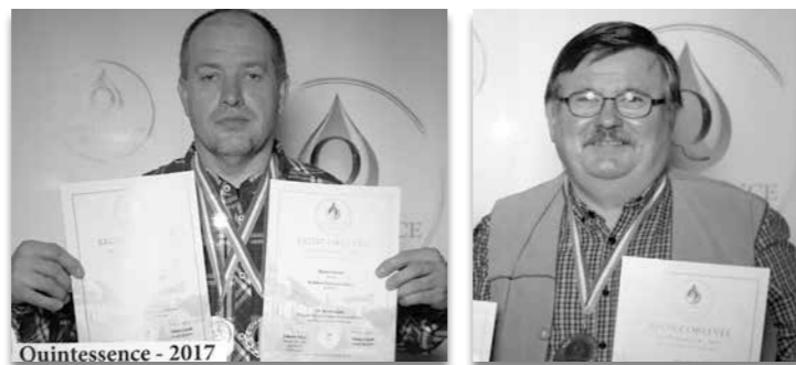
Quintessence - 2017