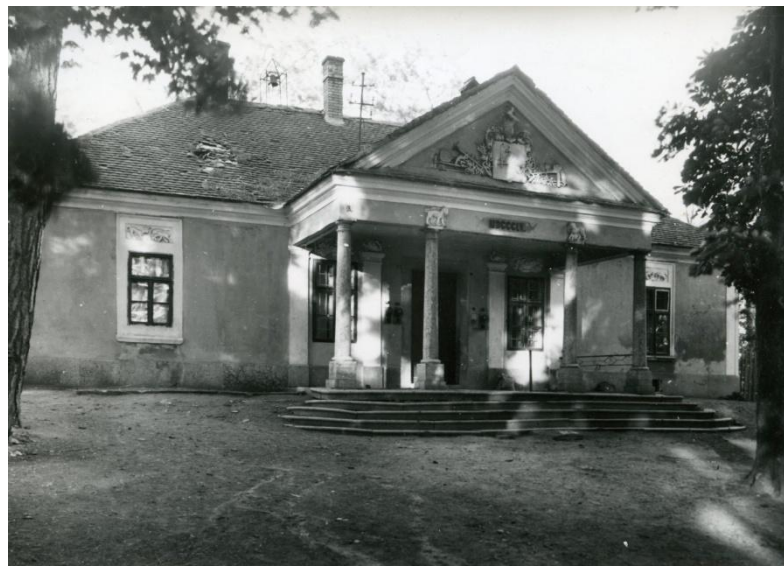
6. kép 42

Tárgyalt épületünk is ebbe a típusba tartozik. (6. kép) A téglalap alaprajzú épület DNy-i hosszanti homlokzata 1 + 3 + 1 tengelyes. A középső 3 tengely előtt öt lekerekített élű vörös mészkő lépcsőfokkal megemelt, négy toszkán fejezetes "gerecsei" vörös mészkő oszlopra támaszkodó portikusz hangsúlyozza a homlokzatot. A portikusz jobb oldalán még látható a vas díszkorlát .