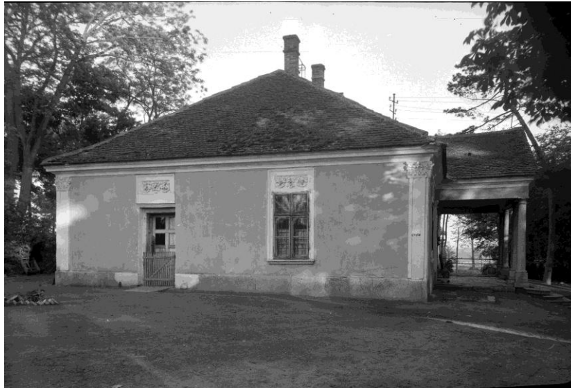
7. kép 43

Ami jelen épületet kiemeli az egyszerűbb kúriák köréből, és valódi történeti értéket képvisel, az a klasszicista kúriák körében ritkán előforduló gazdag, figurális (főleg állat motívumos) dombormű díszítés a portikusz párkányzatának képmézejében, az oszlopok fölötti, és az összes többi homlokzat ablaknyílása fölötti szemöldökökben. A homlokzatokat gazdagon díszített korinthoszi fejezetes pillérek fogják közre.