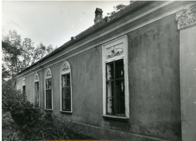
9. kép 46

Az ÉK-i hátsó homlokzat tengelykiosztása megegyezik a főhomlokzatéval: 1 + 3 + 1. Itt is gazdag, állat motívumos domborműveket találunk az ablaknyílások fölött. A homlokzat díszítése - a középső három nyílás félköríves lezárásával - egy a második traktusban kiemelkedő jelentőségű helyiség, társas-fogadó tér szerepét hangsúlyozhatta. (9. kép)